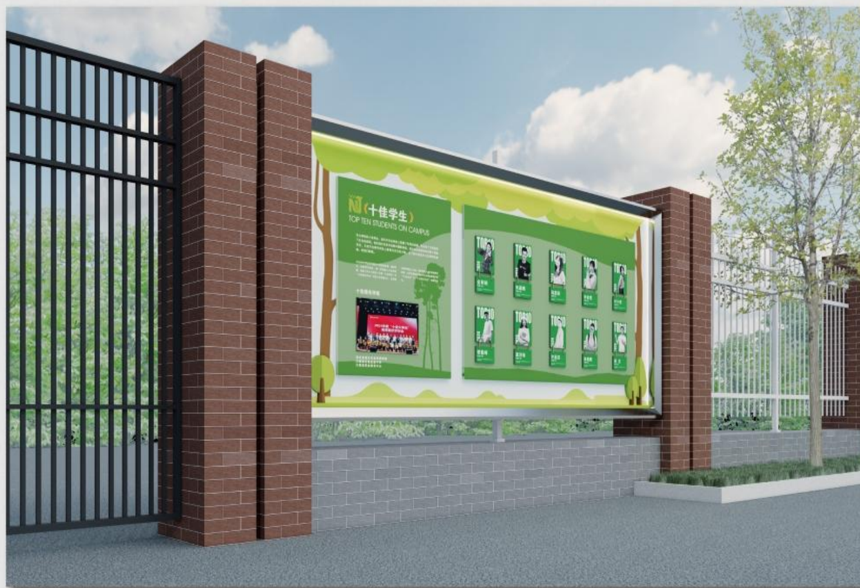
学生风采评比展示栏样式