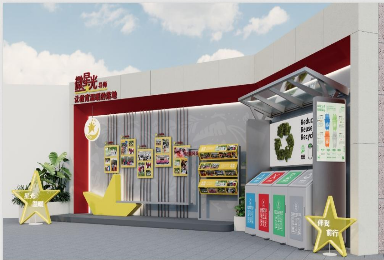
微星光区右侧视角